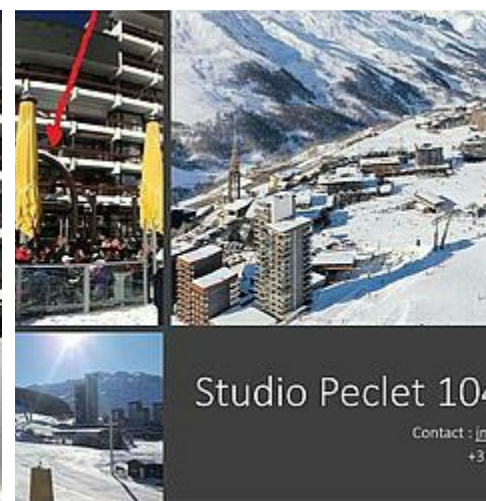
Studio Peclet 104