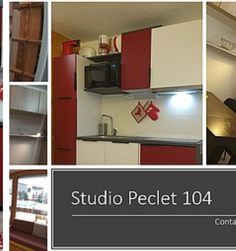
Studio Peclet 104